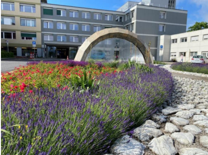
Kantonsspital Freiburg