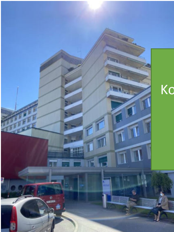
Kantonsspital Freiburg