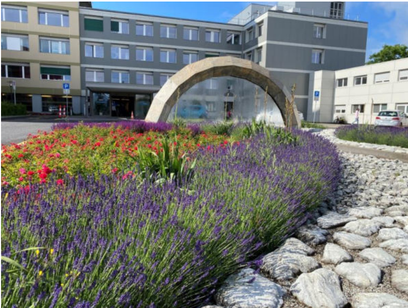
Kantonsspital Freiburg